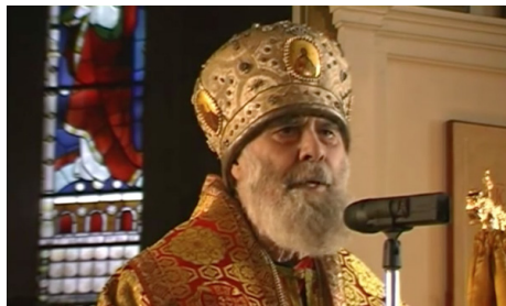
Митрополит Антоний Сурожский

И вот Сын Божий рождается в нашу жизнь; но не от любви мужчины к женщине, Матери Своей к мужу, а от непостижимой любви Божией к нам, людям, и от