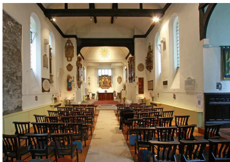
Внутри старой церкви мч. Панкратия

Сент-Панкрас, многие останки обширного кладбища кремировали и перезахоронили под одним ясенем в общей могиле, а вокруг поместили многочисленные сохранившиеся надгробья. Руководил проектом молодой Томас Гарди, будущий знаменитый писатель, архитектор по образованию. Тот ясень сохранился до наших дней и сегодня служит мемориалом Гарди. Среди уникальных памятников кладбища – мемориальный фонтан и солнечные часы.