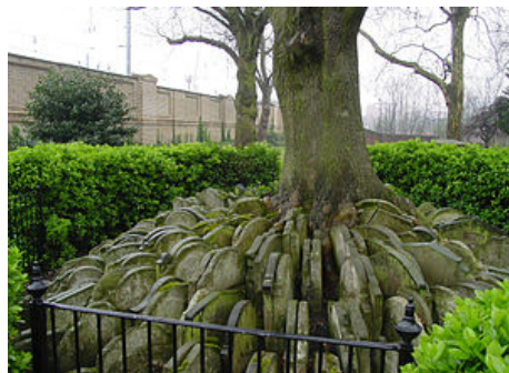
‘Ясень Томаса Гарди’

сохранившаяся часть церковного кладбища. На нем, среди многих других, захоронены архитектор – представитель классицизма Джон Соун (примечательно, что красивый семейный склеп Соуна на этом кладбище послужил архитектору Джайлзу Гилберту Скотту образцом для создания английских красных телефонных будок!); композитор эпохи классицизма Иоганн Кристиан Бах (младший сын великого Иоганна Себастьяна Баха!); скульптор Джон Флакспен (автор надгробий в соборе св. Павла и Вестминстерском аббатстве); последний губернатор провинции Нью-Джерси Уильям Франклин (незаконнорожденный сын Бенджамина Франклина); писательница и философ Мэри Уолстонкрафт (предтеча феминизма; ее дочь – писательница Мэри Шелли, ходила на свидание с Перси Биши Шелли у могилы матери!). В 1860-е годы при строительстве железной дороги и международного вокзала, названного в честь святого