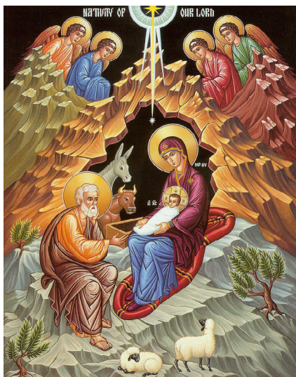
икона Рождества Христова

Бог отдает Своего Сына - да, на земную жизнь, но также и на смерть! На смерть, которая Ему всем чужда, с которой у Него ничего общего нет, потому что смерть является плодом нашей отчужденности от Бога, смерть - это плод греха, мертвость души, которая за собой влечет и умирание тела. Воплощенный же Бог, Богочеловек Господь Иисус Христос и при рождении Своем уже бессмертен: и Он принимает смертность, желая во всем отождествиться с нами, людьми, быть с нами заодно, не отлучаясь ни от любви Божией, ни от единства с Ним, чтобы жить нашей жизнью, но жизнью очищенной, прозрачной ко всему светлому, и умереть нашей греховной смертью. Да! Он умирает нашей смертью, не Своей, потому что - как может Вечная Жизнь умереть?.. Но Он приобщается нам