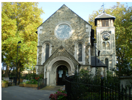
Старая церковь св. мч. Панкратия

Св. Панкратий (память 12/25 мая, покровитель детей) был родом из Фригии. Осиротев, он пересел со своим дядей в Рим, где принял крещение. В 303 году во время гонений Диоклетиана 14-летний Панкратий отказался принести жертву римским богам. Его уговаривал сам император, обещал богатства, но отрок был непоколебим. Тогда его обезглавили, а мощи впоследствии поместили в сохранившуюся до наших дней базилику Сан-Панкратио в Риме. В конце VI века папа Григорий Двоеслов, отправляя миссию св. Августина в Англию, передал часть мощей св. Панкратия, ставшего глубоко почитаемым святым в Англии, где многие