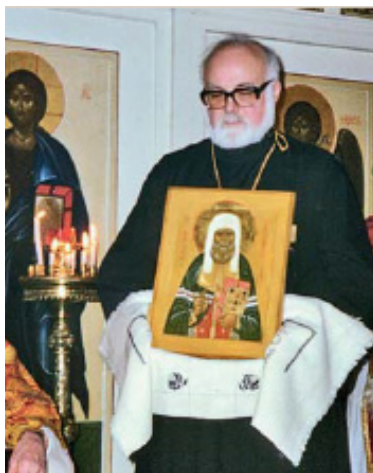
Протоиерей Михаил Фортунато, 1997 г.

В мае 2006 г. Архиерейский Синод Русской Православной Церкви поручил временное управление Суражской епархией архиепископу Корсунскому Иннокентию (Васильеву), а осенью того же года – новопоставленному епископу Богородскому Елисею (Ганабе). В декабре 2007 г. епископ Елисей решением Синода был назначен