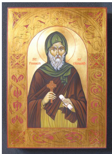
Икона Святого Финиана

После 20 или 30 лет, проведенных в Уэльсе, святой возвратился в Ирландию, где основал множество церквей и монастырей, среди которых были обители в Агхоуле нынешнего графства Уиклоу и в Мугна-Сулкэн. В Агхоуле св. Финиану особенно понравилось, и