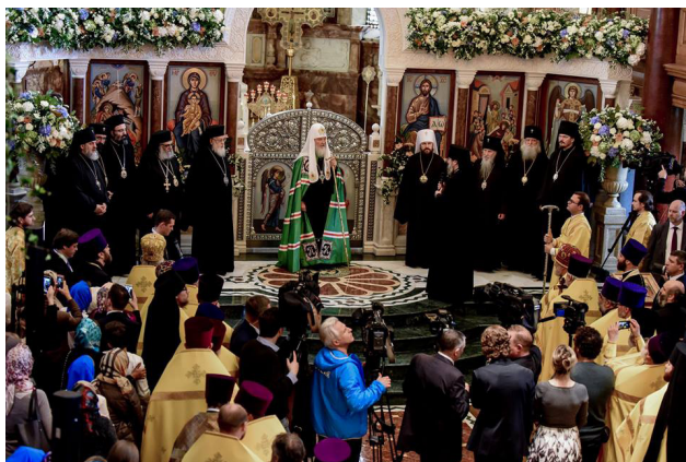
Литургия в Успенском соборе во время визита Святейшего Патриарха Кирилла

очень хорошие, священники часто помогают друг другу, служат друг с другом и поддерживают друг друга в пастырском служении.