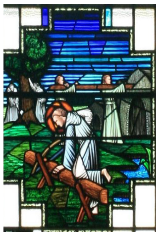
(справа) Витраж св. Финиана и его учеников в католической церкви в честь св. Финиана в Клонарде