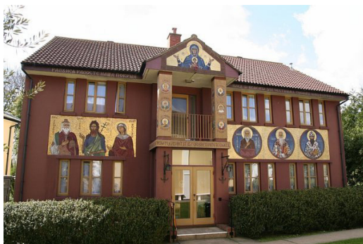
Архимандрит Софроний Сахаров (фото слева) Монастырь св Иоанна Предтечи в Эссексе (фото справа)

многих англикан в этой стране почитание икон вполне приемлемо.