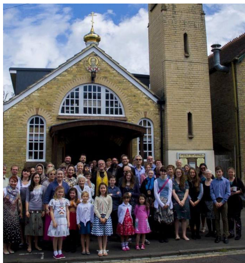
Прихожане прихода св Николая в Оксфорде

поколений. Существуют значительные различия в англиканском сообществе, и сегодня многие англикане придерживаются взглядов, которые трудно и невозможно согласовать с православным пониманием христианского учения. И все же довольно много членов Церкви Англии, от высших иерархов до простых верующих, проявляют большое уважение, тепло и даже любовь к православной традиции, и с ними мы поддерживаем близкие отношения, между нами существует также искренняя дружба, которая очень важна для нас и которую мы хотим сохранить.