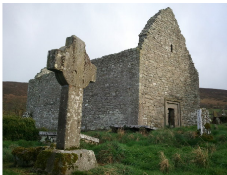
Церковь в Агхоуле, XII век

он думал остаться там навсегда, но ангел снова явился ему и велел идти дальше.