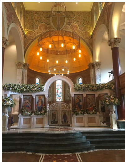
Интерьер собора после ремонта 2016 г