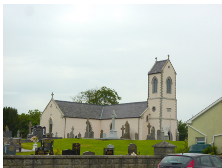
Католическая церковь св. Финиана в Клонарде

нашествия в Ирландию желтой чумы в 549 (или 552) году. Мощи святого игумена хранились в монастырской церкви Клонарда до 887 года, когда были уничтожены. Однако есть письменные свидетельства о том, что небольшая часть его мощей до XVII века хранилась в одном из приходов недалеко от Клонарда. До IX века монастырь Клонард имел период особого расцвета. Игумен Клонарда в то время имел такой же авторитет в центральной Ирландии, какой имел игумен Армы (основанной св. Патриком) в северной Ирландии. К сожалению, Клонард неоднократно подвергался жестокому нападению викингов в период с IX по XI век, и поэтому бывшая слава обители сошла на нет. В XII веке в Клонарде было основано два августинских католических монастыря, один из которых просуществовал до Реформации. Но, несмотря на все Церковные реформы, св. Финиан Клонардский, заслуженно