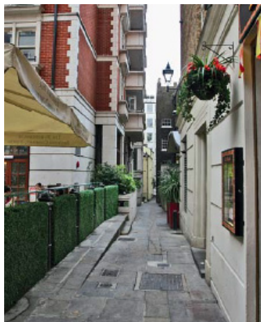
Место появления Русской Православной Церкви в Лондоне. Лондон. Стрэнд. У входа в Эксчейндж-корт (сквозь арку в доме № 419А)

— Общины разбросаны по всем Британским островам, не говоря уже о Нормандских островах и острове Мэн. Это означает, что все наши священники должны быть миссионерами. Многие из них окормляют несколько приходов, путешествуя на большие расстояния каждую неделю, чтобы заботиться о нуждах нашей паствы. Кроме того, наше духовенство старается выполнять много разных задач — не только служить Божественную литургию и совершать таинства, но и проповедовать, посещать больницы и тюрьмы, следить за административными делами и т.д. Многие священники, чтобы прокормить свои семьи, трудятся на светской работе, поэтому служить в нашей епархии — это