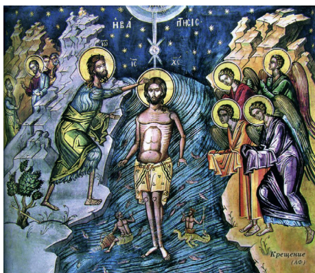
Икона Крещение Господне

отмечаемый особым богослужением, более торжественным, чем в обычные дни поспразднства.