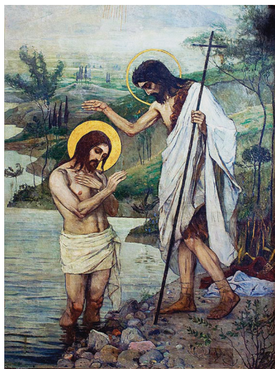
Крещение Господне (Богоявление) М. Нестеров (1890-1894 гг) Роспись в крестильне Владимирского собора в Киеве

Крещение Господне часто вызывает недоумение: зачем Христу надо было креститься? Ведь Иоанн Креститель, выходя на проповедь, призвал всех каяться в своих грехах, очиститься от всякой скверны, выправить в своей жизни то, что пошло вкривь и вкось, направить всю свою жизнь, и душу, и ум, и волю в действие на поклонение и служение Богу. Но разве это нужно было Христу? Он же был свободен от греха, Он же был Сам Бог, ставший человеком; зачем же крещение? Один западный богослов, образованный и тонкий протестантский пастор мне так это объяснил, — и мне его объяснение запало в душу: он говорил, что в рождестве Христове человеческая плоть, человеческая личность Христа как бы пассивна; Он — новорожденный ребенок. И в какой-то момент Он должен как человек взять на Себя то поручение, которое Ему дано Богом и Отцом. В Своем